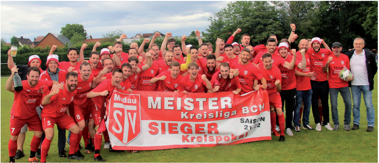
TSV Mudau, Meister der Kreisliga und Pokalsieger.