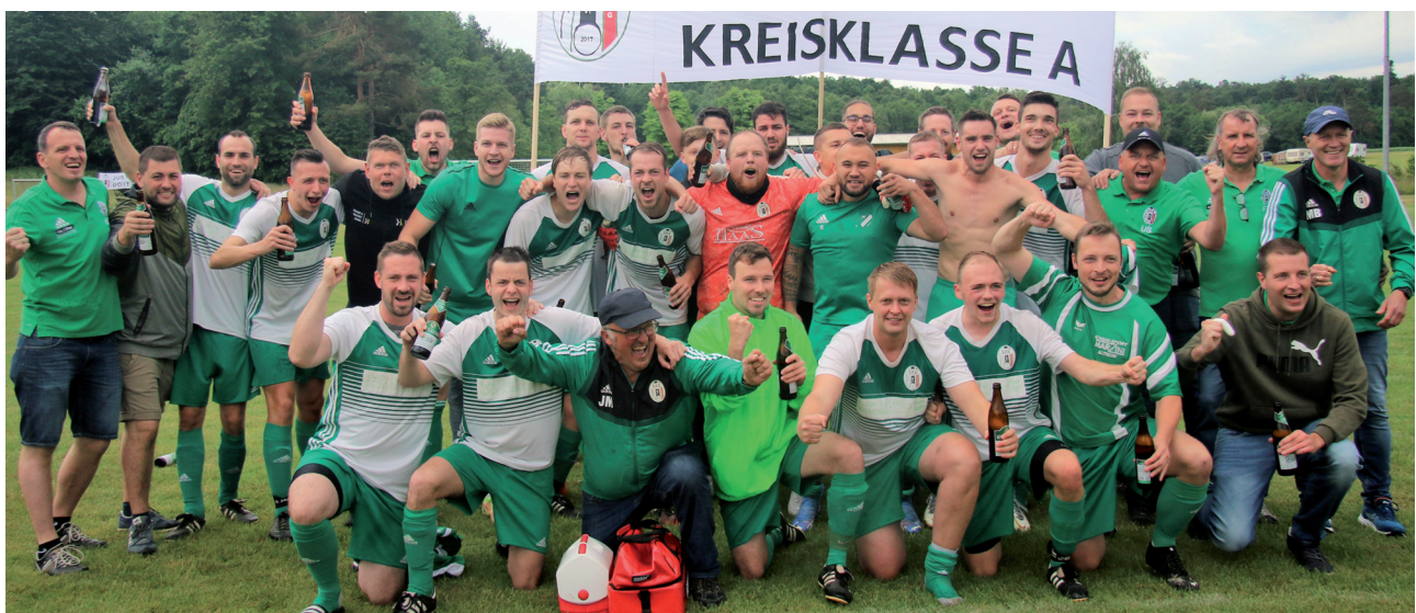
SpG Rippberg/Wettersdorf-Glashofen, Meister der Kreisklasse A.