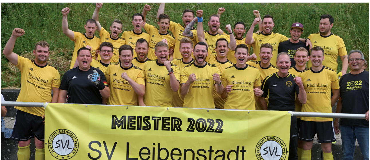
SV Leibenstadt, Meister der Kreisklasse B.