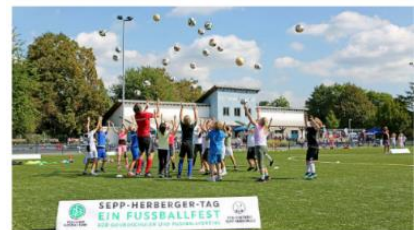
KOOPERATIONSVEREINBARUNG FÜR EINEN SEPP-HERBERGER-TAG – EIN FUSSBALLFEST FÜR GRUNDSCHULEN UND FUßBALLVEREINE